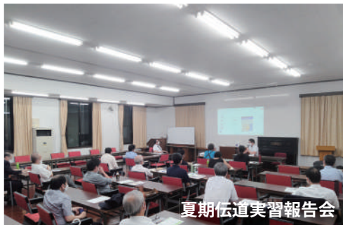
夏期伝道実習報告会